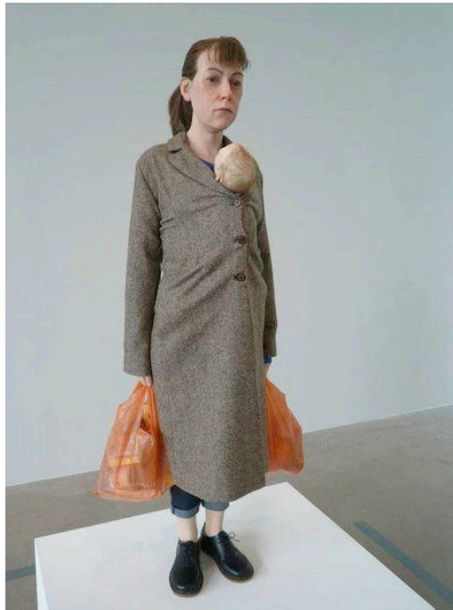
RWoman with Shoppingon - Mueck,, 2013.

Un grand merci aux participantes de cette AG et à celles qui étaient avec nous, en pensée.